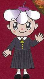
藤枝順心マスコットキャラクター「JUNちゃん」